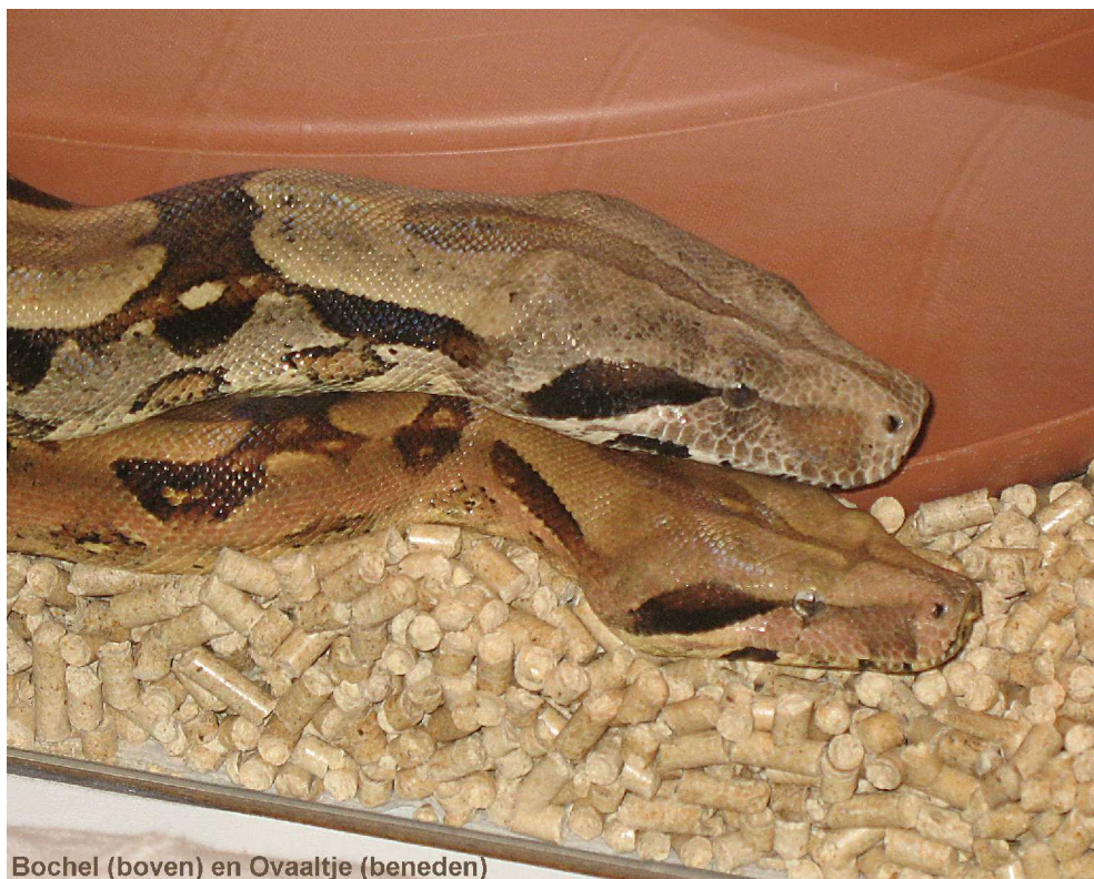
Bochel (boven) en Ovaaltje (beneden)

Then children who wanted could have one of the snakes on their lap. Sitting on the edge of the podium worked very well.