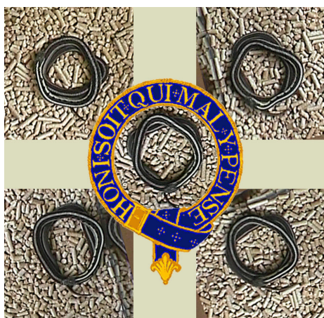
Figuur 2A / Figure 2A. Tweedimensionaal Kousenbandembleem. Richting: rechtson (2A) en linksom (2B). Met rechts- resp. linksom draaiende slang.